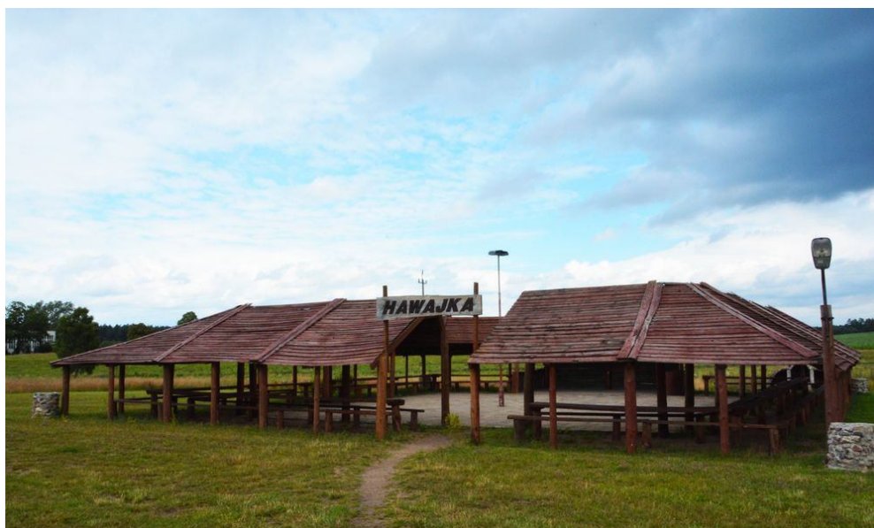
Ilustracja 2 Miejsce spotkań "Hawajka" w Zegrzu Pomorskim

W celach rekreacyjno-sportowych oraz jako miejsce spotkań plenerowych sołectwo wykorzystuje teren boiska ale także kompleks sportowo – rekreacyjny w Zegrzu Pomorskim, który położony jest za budynkiem mieszczącym się pod adresem Zegrze Pomorskie 26A.