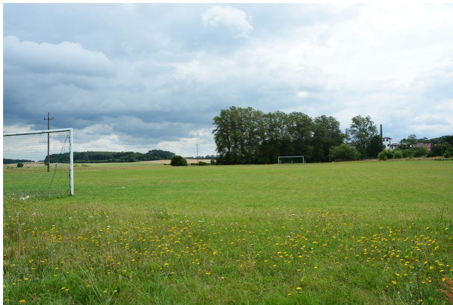
Ilustracja 3 Boisko sportowe w Zegrzu Pomorskim

W kompleksie znajduje się trawiaste boisko piłkarskie oraz miejsce przeznaczone do organizacji spotkań i zabaw sołeckich tzw. „Hawajka”, zbudowana z trzech wiat drewnianych oraz miejsca przeznaczonego na ognisko. Place zabaw znajdują się również w miejscowościach Sieranie i Czaple.