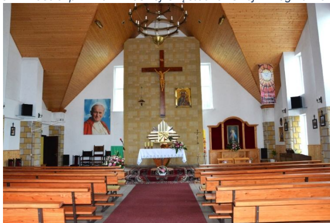
Rysunek 1 Kościół pw. Marki Boskiej Częstochowskiej w Zegrzu Pomorskim