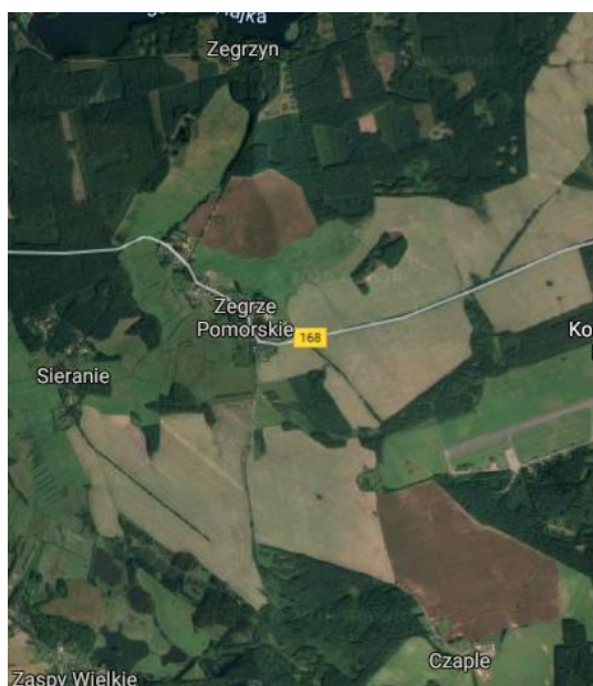
Ilustracja Obszar sołectwa Zegrze Pomorskie