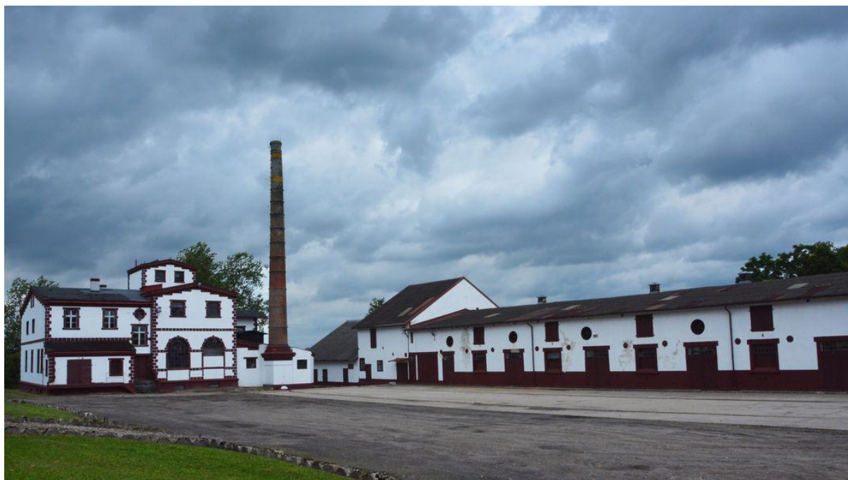
Rysunek 2 Kompleks pałacowo-folwarczny w Zegrzu Pomorskim. Obecnie siedziba firmy Goodvalley

Charakterystycznym elementem struktury przestrzennej Zegrza Pomorskiego jest kompleks pałacowo-folwarczny z przylegającym do niego parkiem dworskim. Całość pochodzi z drugiej połowy XVIII i przełomu XIX i XX wieku. W skład kompleksu poza pałacem wchodzi gorzelnia oraz kilkupiętrowy spichlerz.