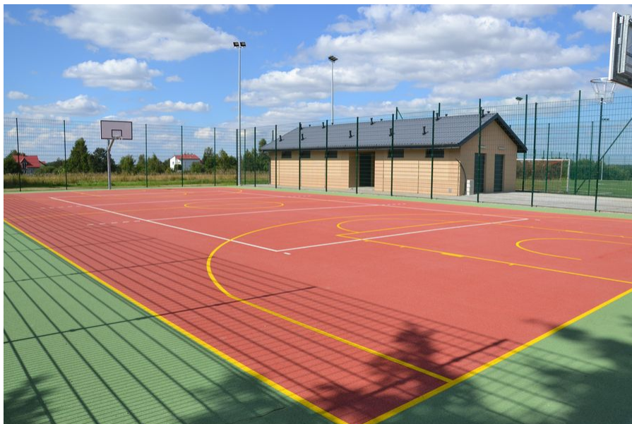
Ilustracja 6. Orlik w Świeszynie

Kolejnym obiektem wykorzystywanym przez mieszkańców sołectwa Świeszyno w celach plenerowych spotkań integrujących lokalną społeczność, jest teren należący do Multimedialnego Centrum Kultury „e-Eureka” - Biblioteka Publiczna w Świeszynie. Znajdują się tam m.in. klimatyczny amfiteatr, stoły biesiadne i wyznaczone miejsce do palenia ogniska.