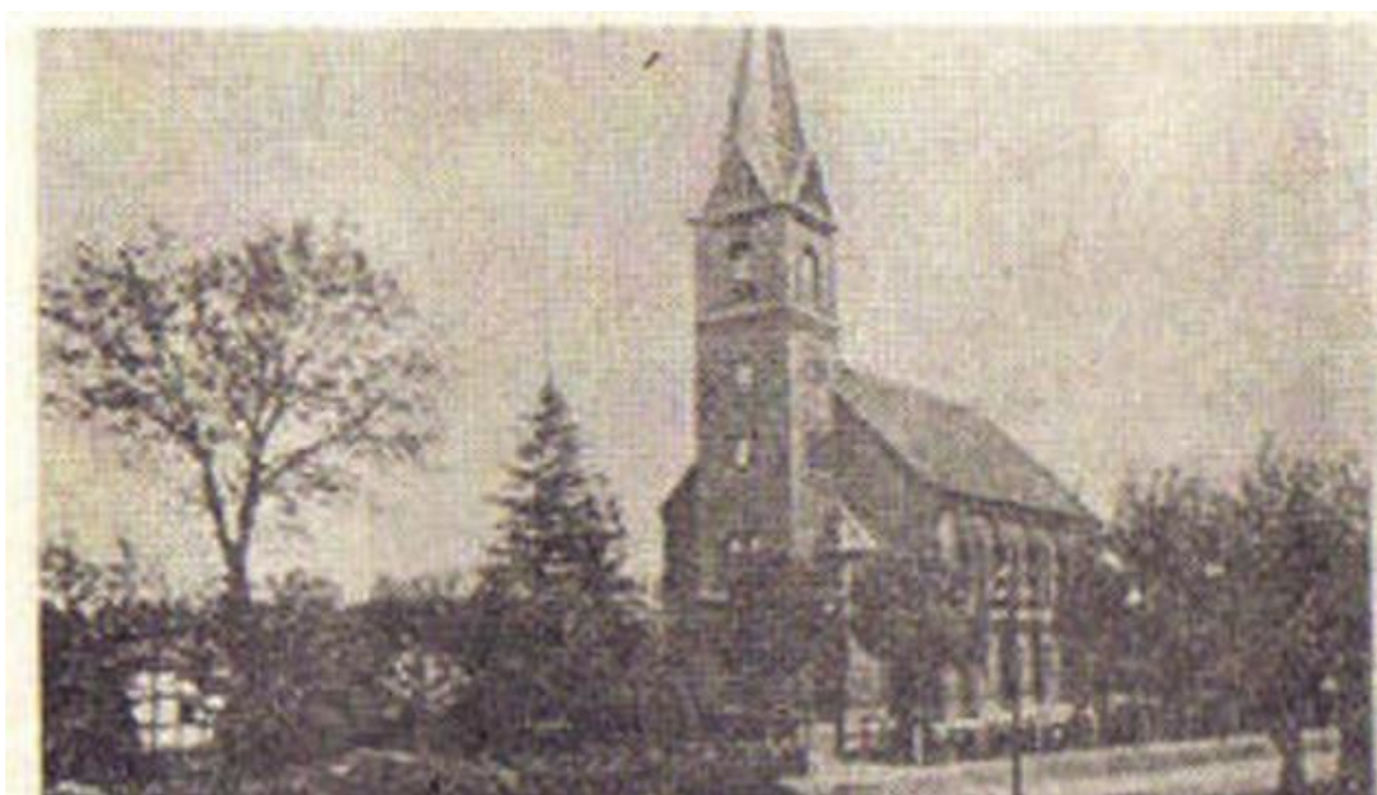
Ilustracja 2. Kościół w Świeszynie w roku 1931.

Nazwa miejscowości Świeszyno pojawia się po raz pierwszy w dokumentach w 1300r. jako Suessyn. W 1832 roku miejscowość liczyła 3168 hektarów. Po porozumieniu dziedziców i chłopów, należało do niej jeszcze 9 domów, które przylegały częściowo do folwarku, a częściowo do chłopów. W Świeszynie znajdowały się wiatraki. Uprawiane były przede wszystkim ziemniaki. Ogrody zakładane były dla własnych potrzeb. Niewielu mieszkańców zajmowało się hodowlą drobiu. W latach 1975-1998 miejscowość administracyjnie należała do województwa koszalińskiego.