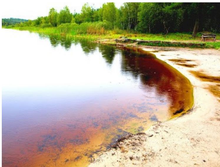
Ilustracja 3. Jezioro Czarne