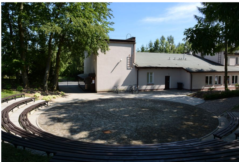
Ilustracja 7. Amfiteatr przy MCK „e-Eureka” - Biblioteka Publiczna w Świeszynie

Kolejnym obiektem wykorzystywanym przez mieszkańców sołectwa Świeszyno w celach plenerowych spotkań integrujących lokalną społeczność, jest teren należący do Multimedialnego Centrum Kultury „e-Eureka” - Biblioteka Publiczna w Świeszynie. Znajdują się tam m.in. klimatyczny amfiteatr, stoły biesiadne i wyznaczone miejsce do palenia ogniska.