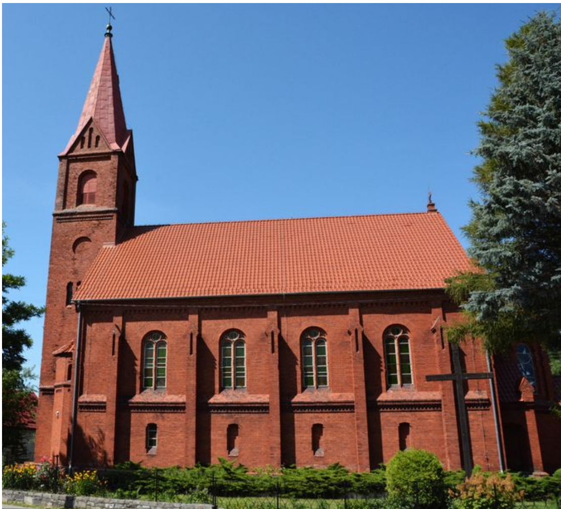
Ilustracja 5. Kościół pw. Narodzenia Najświętszej Maryi Panny w Świeszynie