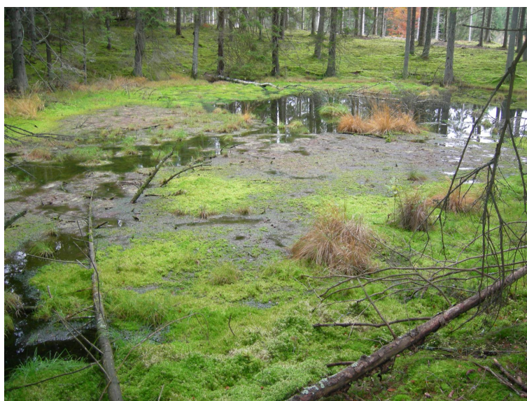
Ilustracja 4. Torfowiska "Wiązogóry"

Pomniki przyrody uchwalone Uchwałą Nr V/32/03 z dnia 6 marca 2003r. Rady Gminy Świeszyno: