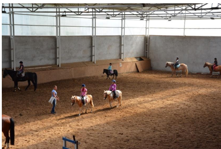
Ilustracja nr 4. Stadnina koni w Nieklonicach