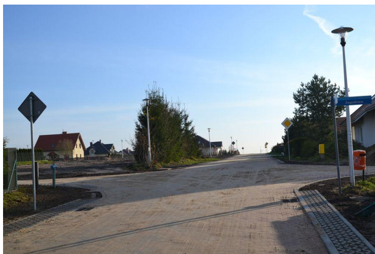
Ilustracja nr 6. Nowo wybudowana droga w Niekłonicach przy ulicach: Truskawkowa, Jagodowa oraz ulica Brzoskwiniowa

Drogi – w 2016 roku przebudowana została droga powiatowa nr 3529Z Koszalin – Niekłonice oraz Giezkowo – Dunowo. W ramach Programu Rozwoju Gminnej i Powiatowej Infrastruktury Drogowej, Gmina Świeszyno otrzymała dofinansowanie inwestycji realizowanej pn. „Przebudowa dróg gminnych wraz z infrastrukturą towarzyszącą w miejscowości Niekłonice” (ul. Jagodowa, Truskawkowa i Brzoskwiniowa). Drogi o łącznej długości 1278 mb wyłożono kostką brukową. W efekcie powstały jezdnie dwukierunkowe z oznakowaniem drogowym. W bardzo złym stanie technicznym jest droga powiatowa nr 3530Z łącząca miejscowość Niekłonice – Konikowo. Pozostałe drogi gminne posiadają nawierzchnię gruntową.