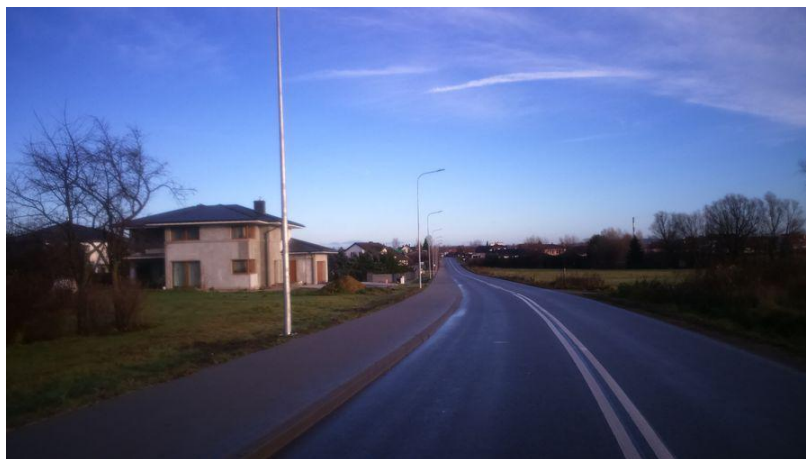
Ilustracja nr 7. Oświetlenie typu LED wzdłuż drogi powiatowej nr 3529Z w Niekłonicach

Energetyka – potrzeby mieszkańców w zakresie energetyki są zaspokajane w stopniu wystarczającym. W listopadzie 2016 roku, dokonano odbioru końcowego robót w ramach inwestycji pn.: „Budowa energooszczędnego oświetlenia typu LED w m. Niekłonice”. W ramach zadania na odcinku ponad dwóch kilometrów drogi powiatowej nr 3529Z powstały 73 punkty oświetleniowe z energooszczędnymi oprawami LED.