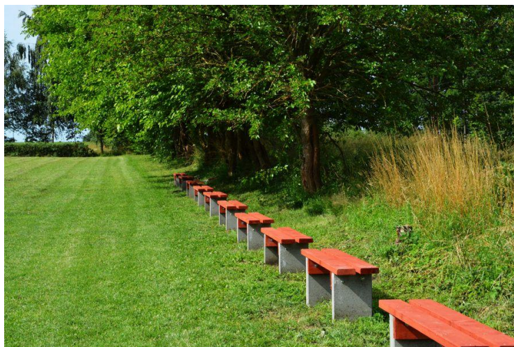
Ilustracja nr 2. Boisko sportowe w Nieklonicach

W 2015 roku w miejscowości powstała duża sala weselna „Na Farmie”, mieszcząca do 150 osób, oferująca zaplecze gastronomiczne oraz pokoje dla gości.