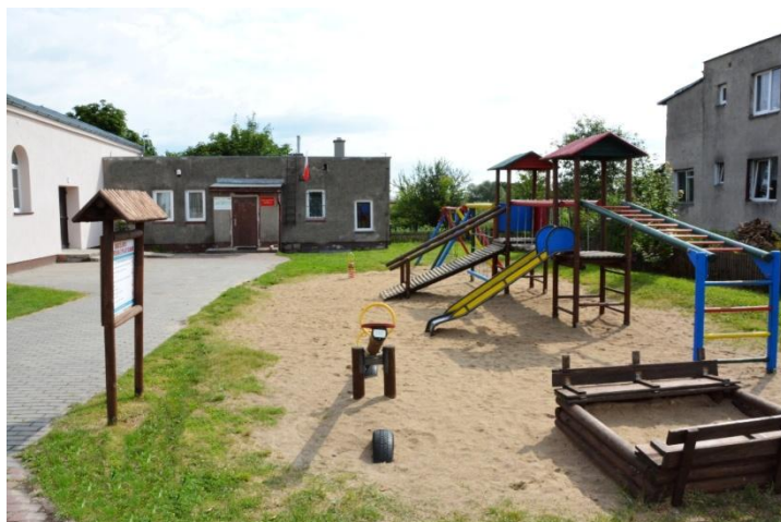
Ilustracja nr 3. Świetlica wiejska oraz plac zabaw w Nieklonicach