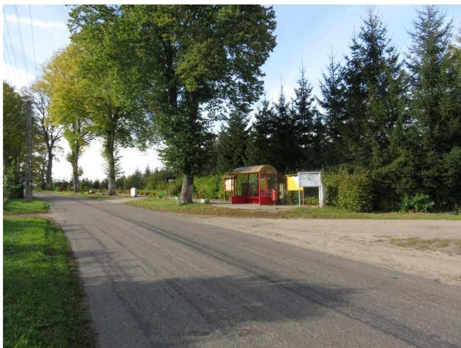
Ilustracja nr 2. Centralna część wsi Kurozwęcz

Kurozwęcz to miejscowość o prostym układzie osadniczym, o typie zabudowy ulicówka (jednodrożna wieś o zwartej zabudowie po obu stronach drogi oraz przypadkowym układzie dróg bocznych), położona po obu stronach drogi wojewódzkiej nr 168. Zabudowę stanowią głównie budynki wielorodzinne. W centralnej części wsi znajduje się nowo wybudowana leśniczówka Leśnictwa Kurozwęcz, przynależącego do Nadleśnictwa w Tychowie.