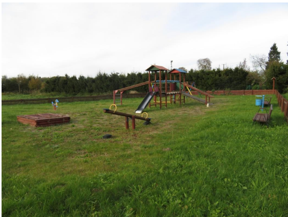
Ilustracja nr 6. Plac zabaw w Kurozwęczu

W celach rekreacyjno-sportowych oraz jako miejsce spotkań plenerowych sołectwo wykorzystuje teren będący w centralnym punkcie miejscowości, w którego obrębie znajduje się boisko piłkarskie oraz boisko do siatkówki plażowej. Na terenie wsi znajdują się również plac zabaw dla dzieci i młodzieży oraz świetlica wiejska, która mieści się zaraz przy wjeździe do Kurozwęcza, po prawej stronie drogi wojewódzkiej nr 168, w której organizowane są różnego rodzaju imprezy kulturalne, spotkania, zebrania sołeckie oraz zajęcia plastyczne, kulinarne, muzyczne bądź sportowe.