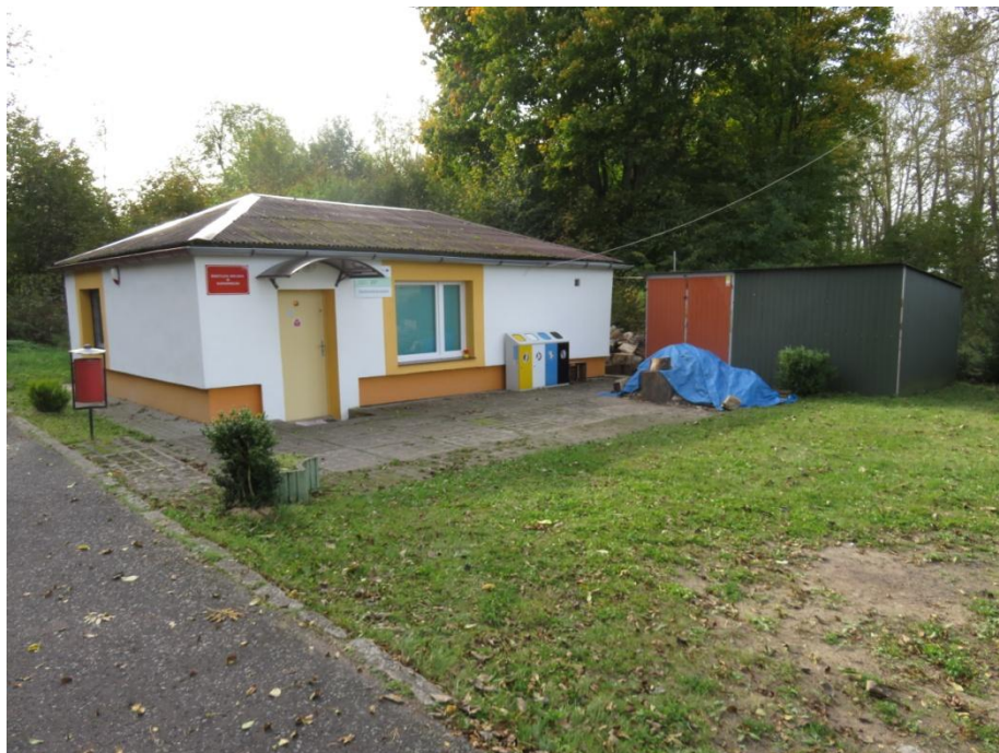
Ilustracja nr 7. Świetlica wiejska sołectwa Kurozwęcz