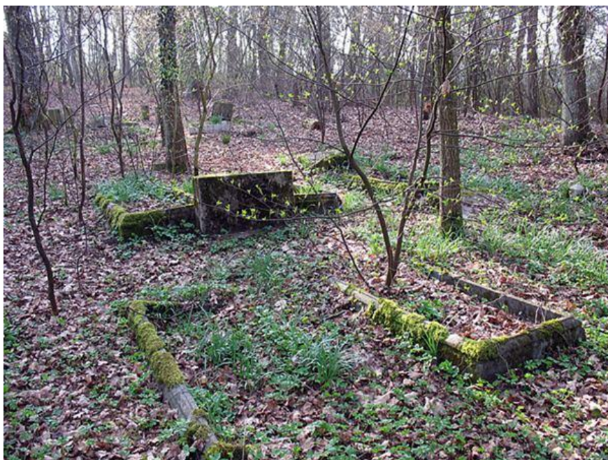
Ilustracja nr 5. Poewangelicki cmentarz w Kurozwęczu

Na terenie sołectwa znajduje się stary, poewangelicki cmentarz o powierzchni około 0,35 ha. Do zabytków nieruchomych można zaliczyć także sygnalizacyjną, metalową wieżę lotniczą, przynależącą do tutejszego dawnego lotniska. W Kurozwęczu znajdują się także kilkanaście stanowisk archeologicznych.