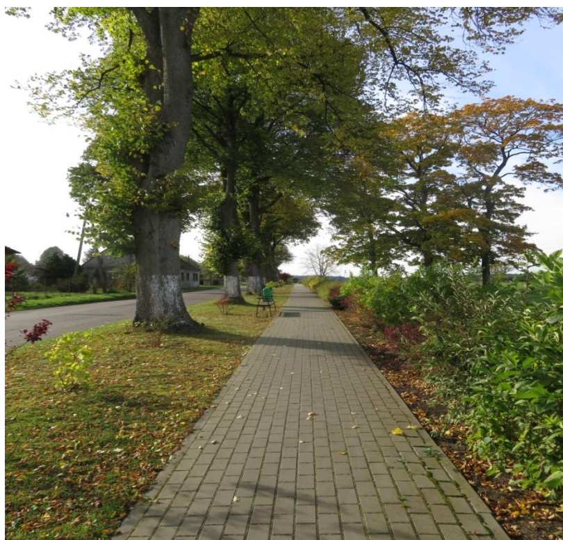
Ilustracja nr 3. Lipy rosnące wzdłuż drogi wojewódzkiej nr 168 w Kurozwęczu

Do znajdujących się na terenie sołectwa Kurozwęcz ciekawych okazów starodrzewu należą okazałe lipy, ciągnące się wzdłuż głównej drogi. W centralnej części znajduje się niewielki zbiornik wodny, porośnięty w większości sitowiem, w którym żyją różnego rodzaju płazy. Akwen ten jest także siedliskiem dla kaczki krzyżówki.