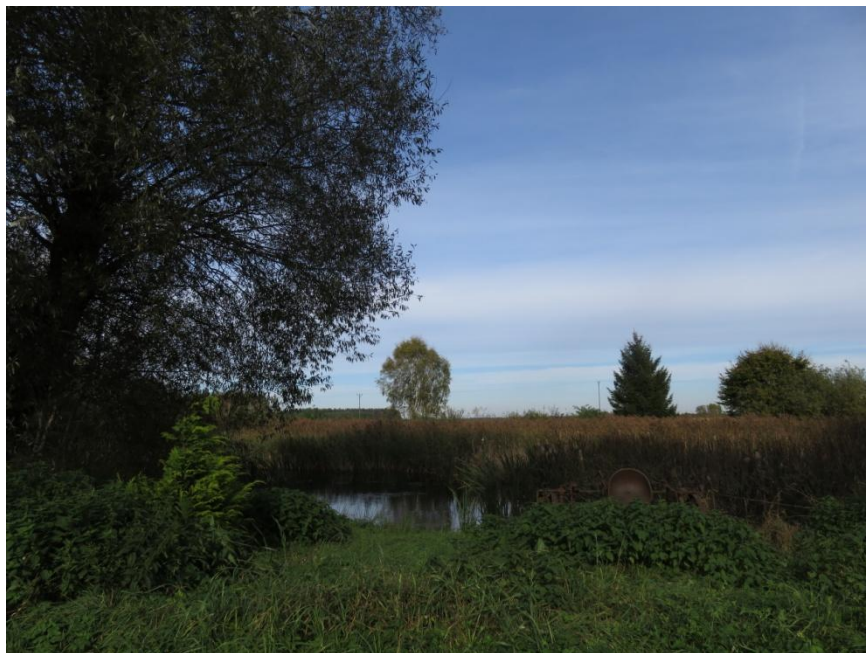
Ilustracja nr 4. Zbiornik wodny w Kurozwęczu