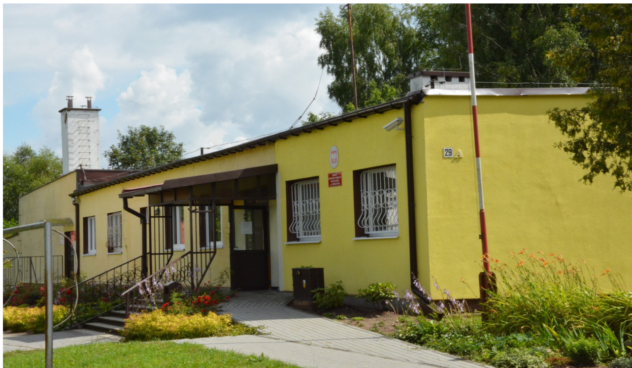
Ilustracja 6. Budynek Miejskiego Ośrodka Pomocy Społecznej, biblioteki i świetlicy w Niedalinie

sołectwa. W Niedalinie mieści się także Gminny Ośrodek Pomocy Społecznej z siedzibą w budynku po dawnej szkole podstawowej.