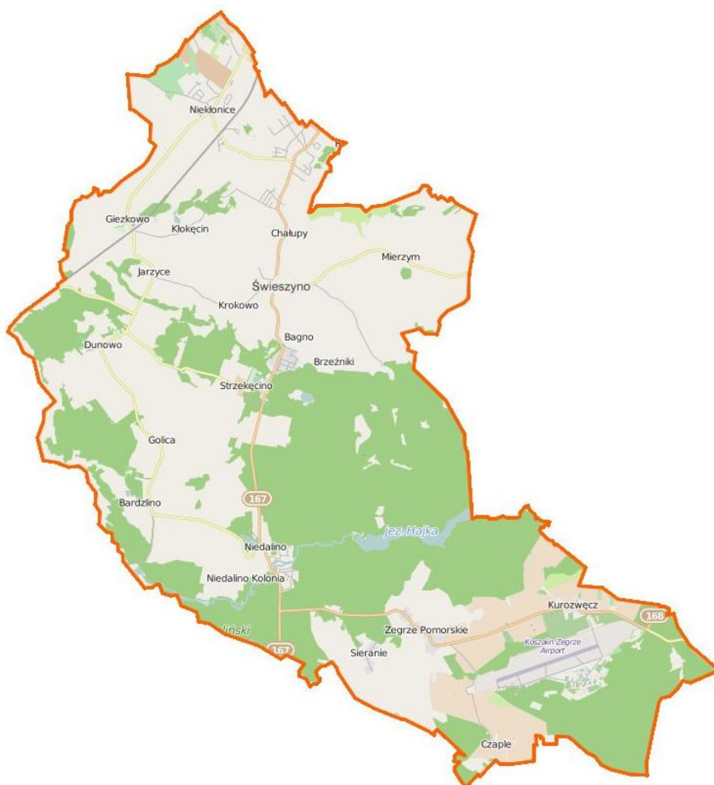
Ilustracja 1. Mapa obszaru Gminy Świeszyno

Sołectwo Niedalino położone jest w województwie zachodniopomorskim, w powiecie koszalińskim, w południowo-zachodniej części Gminy Świeszyno, w odległości 6 km od Świeszyna i 16 km od Koszalina. Stolica sołectwa - Niedalino znajduje się przy drodze wojewódzkiej nr 167, przed skrzyżowaniem z drogą wojewódzką nr 168. W skład sołectwa wchodzi sześć miejscowości: Niedalino, Bardzino, Czacz, Golica, Wiązogóra i Węgorki. Powierzchnia sołectwa wynosi 3 760,90 ha.