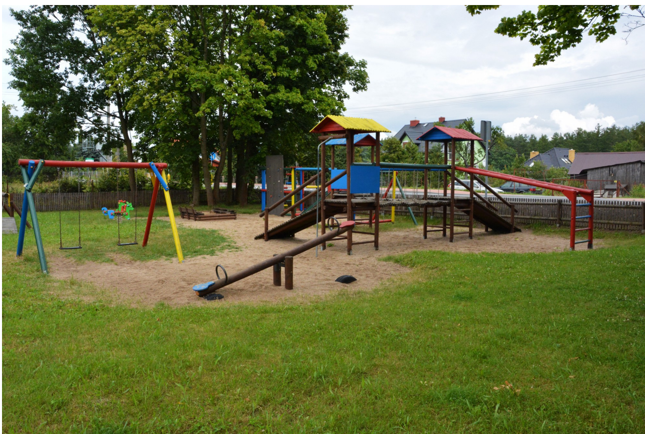
Ilustracja 5. Plac zabaw w Niedalinie

W celach rekreacyjno–sportowych oraz jako teren spotkań plenerowych wykorzystywane jest boisko w Niedalinie wraz z przylegającym do niego malowniczo położonym terenem nad rzeką Radew. Odbywają się tam imprezy o wymiarze zarówno gminnym jak i powiatowym, takie jak: festyny rodzinne, dożynki gminne i powiatowe, zawody sportowe i strażackie oraz inne. W miejscowościach Niedalino, Bardzolino i Golica znajdują się place zabaw dla dzieci.