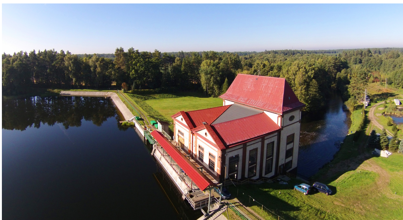
Ilustracja 2. Elektrownia wodna w Niedalinie

Miejscowości należące do sołectwa Niedalino mają zabudowę wielodrożną, nieregularną. Zabudowę stanowią zarówno budynki wielorodzinne jak i domy jednorodzinne. Obecnie sołectwo Niedalino staje się terenem budownictwa jednorodzinnego. Charakterystycznym elementem sołectwa jest malowniczo usytuowana elektrownia wodna wybudowana na przełomie 1911 i 1912 roku nad jeziorem Hajka - powstałego na skutek spiętrzenia rzeki Radew, w celu uzyskania odpowiedniej różnicy poziomów.