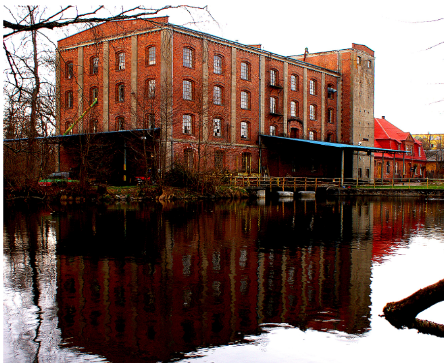
Ilustracja 4. Nieczynny młyn zbożowy w Niedalinie