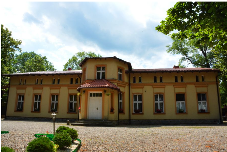
Ilustracja 1. Dworek w Giezkowie