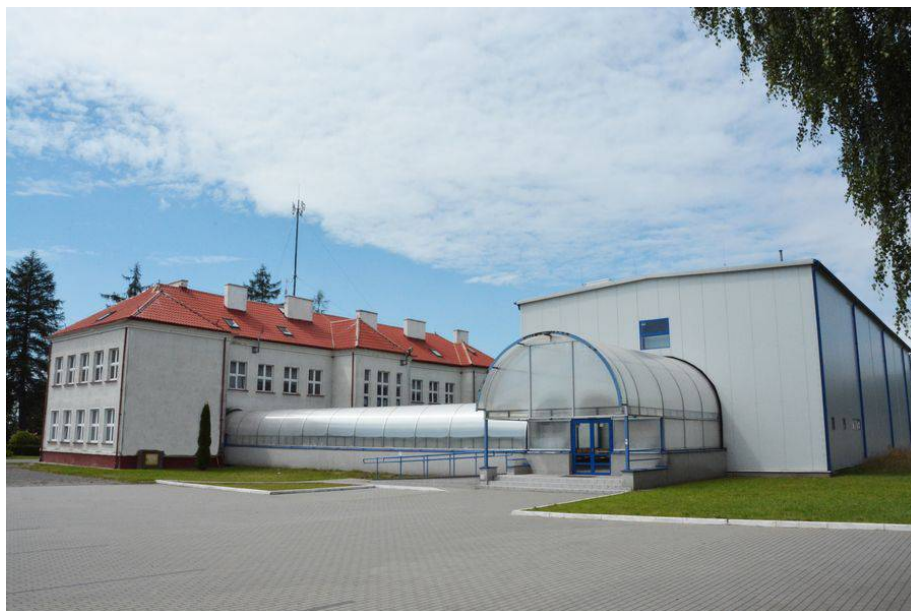
Ilustracja 4. Hala sportowa przy Szkole Podstawowej w Konikowie

W celach rozwijania kultury fizycznej i aktywnego wypoczynku mieszkańcom sołectwa, ale i całej gminy służy oddana do użytku w 2010r. hala sportowa przy szkole podstawowej, wyposażona w zaplecze socjalne i magazynowe oraz trybunę (120 miejsc siedzących).