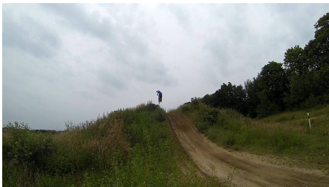
Ilustracja 3. Tor motocrossowy w okolicach Konikowa

W celach rekreacyjno–sportowych oraz jako miejsce spotkań plenerowych sołectwo wykorzystuje teren przy świetlicy wiejskiej, sąsiadujący ze szkołą podstawową. Znajduje się tam plac zabaw, boisko do siatkówki i boisko do piłki nożnej. Dla amatorów sportów motorowych godny polecenia jest położony niedaleko miejscowości tor motocrossowy, na którym regularnie odbywają się różnej rangi zawody.