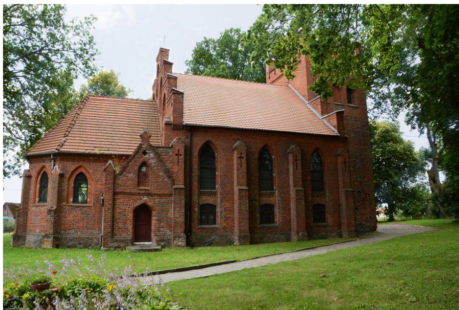
Ilustracja 2. Kościół pw. Najświętszego Serca Pana Jezusa w Konikowie