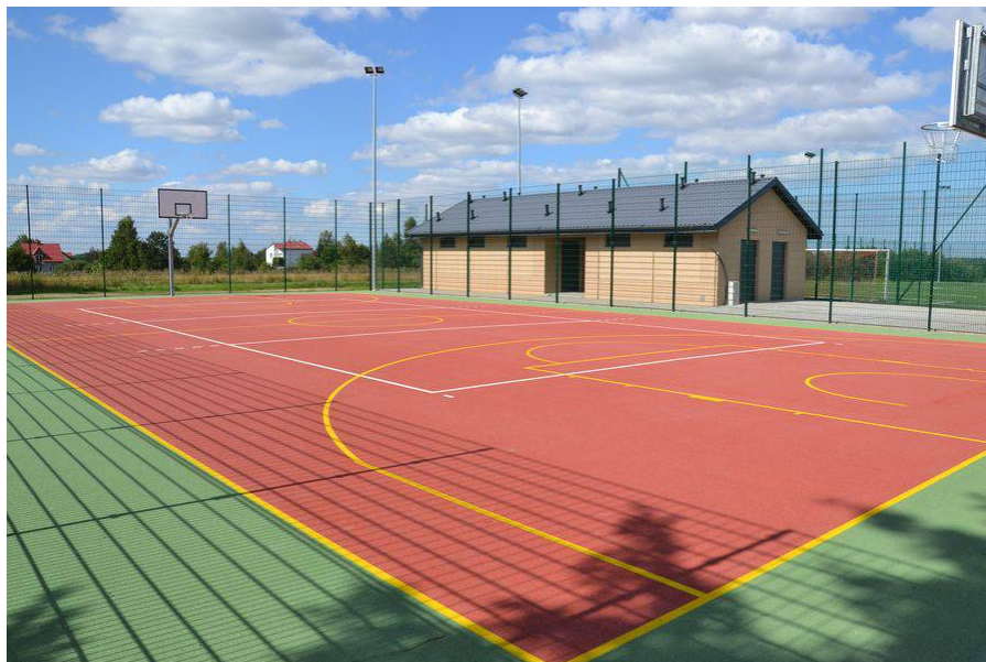
Ilustracja 6. Orlik w Świeszynie

Kolejnym obiektem wykorzystywanym przez mieszkańców sołectwa Świeszyno w celach plenerowych spotkań integrujących lokalną społeczność, jest teren należący do Multimedialnego Centrum Kultury „e-Eureka” - Biblioteka Publiczna w Świeszynie. Znajdują się tam m.in. klimatyczny amfiteatr, stoły biesiadne i wyznaczone miejsce do palenia ogniska.