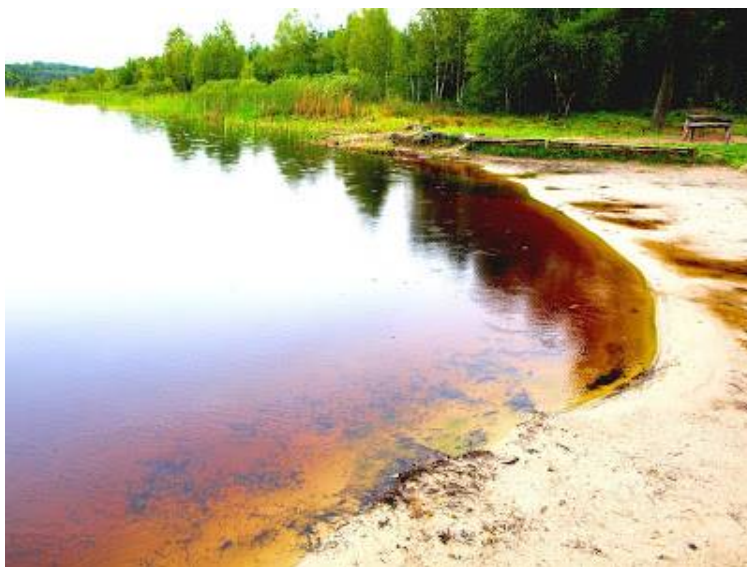
Ilustracja 3. Jezioro Czarne